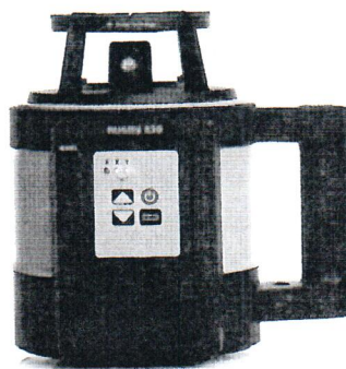
Leica Rugby 830