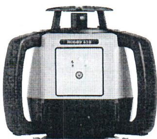
Leica Rugby 610

Общий вид нивелиров лазерных ротационных Leica Rugby серий 600, 800: