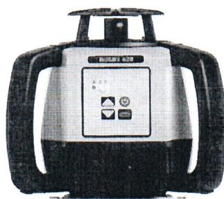
Leica Rugby 620