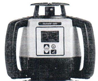
Leica Rugby 670 Leica Rugby 680