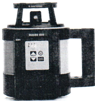
Leica Rugby 820