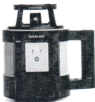
Leica Rugby 810