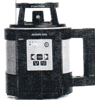
Leica Rugby 840

Пломбирование крепёжных винтов корпуса нивелиров лазерных ротационных Leica Rugby серий 600, 800 не производится, ограничение доступа к узлам обеспечено конструкцией крепёжных винтов, которые могут быть сняты только при наличии специальных ключей.