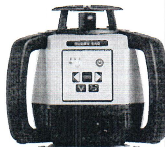
Leica Rugby 640